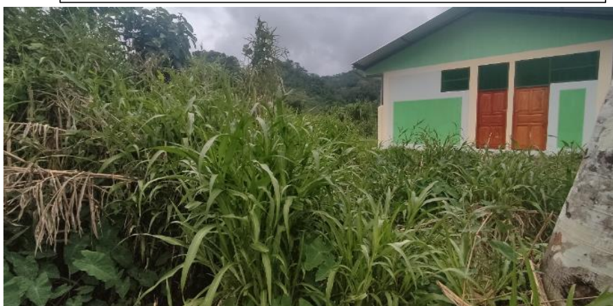
FIGURA N°02: ESTRUCTURA EN RIESGO POR PELIGRO DE INUNDACIÓN DE LA QUEBRADA VISTA ALEGRE