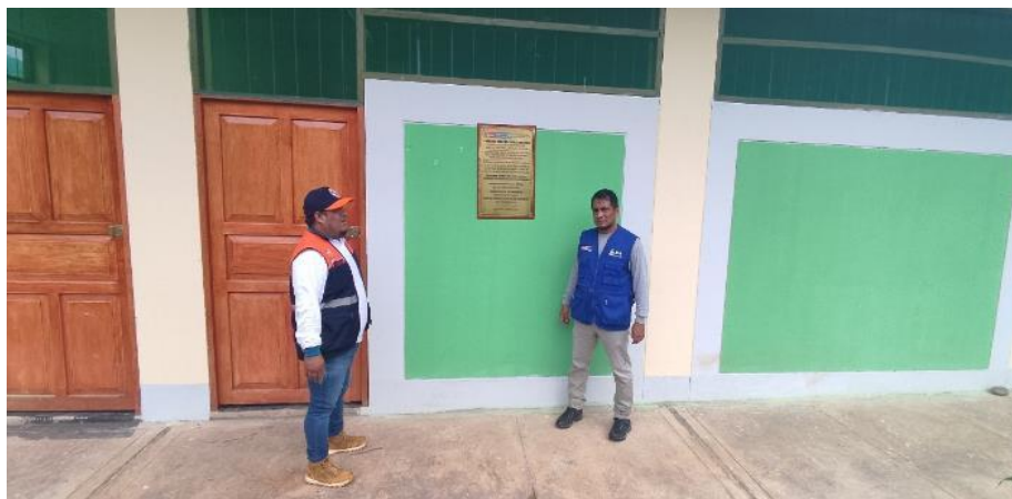
FIGURA N°03: LOCAL MULTI USO EN RIESGO POR PELIGRO DE INUNCADIÓN DE LA QUEBRADA VISTA ALEGRE