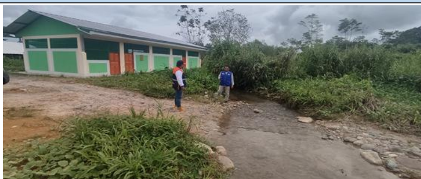
FIGURA N°01: TRAMO DONDE SE REALIZARÁ LOS TRABAJOS DE DESCOLMATACIÓN DE LA QUEBRADA VISTA ALEGRE